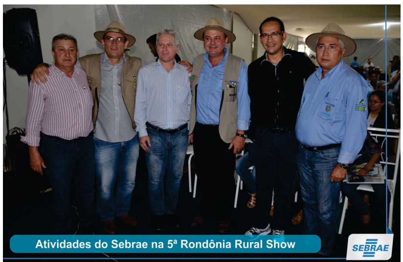
Atividades do Sebrae na 5ª Rondônia Rural Show