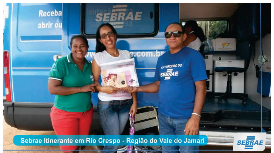
Sebrae Itinerante em Rio Crespo - Região do Vale do Jamari