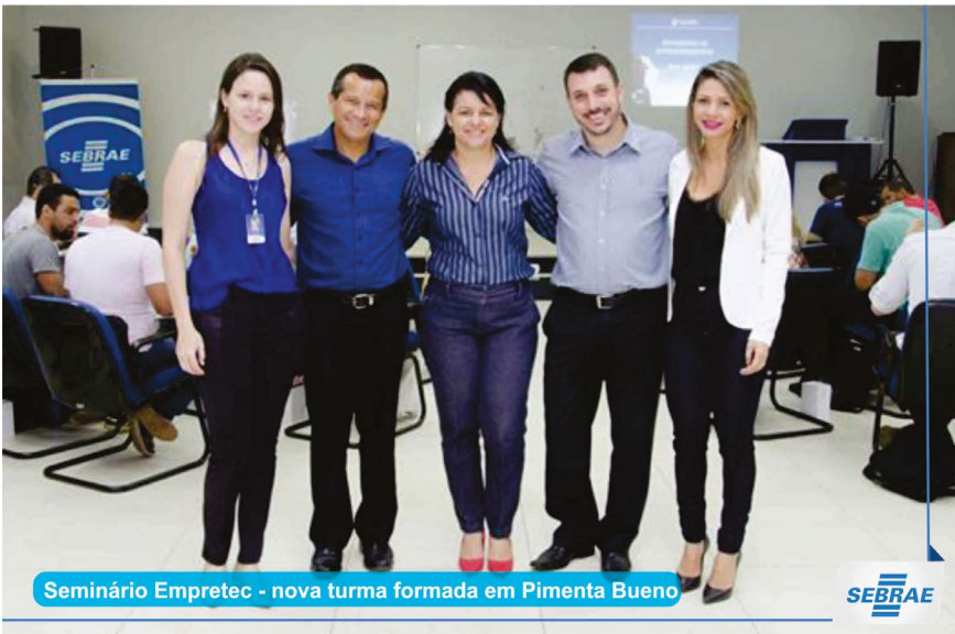
Seminário Empretec - nova turma formada em Pimenta Bueno