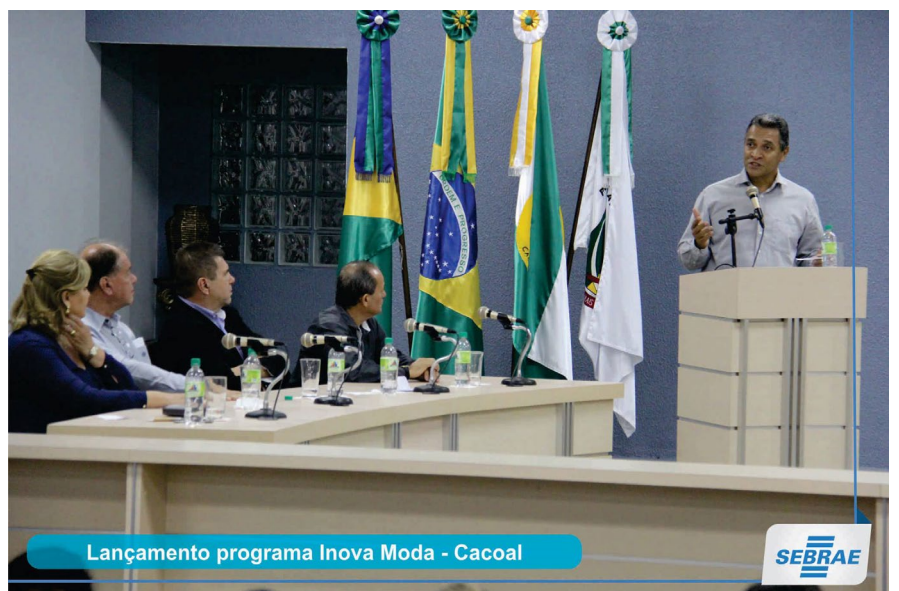
Lançamento programa Inova Moda - Cacoal