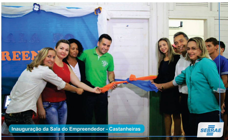
Inauguração da Sala do Empreendedor - Castanheiras