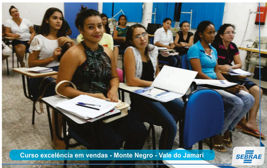
Curso excelência em vendas - Monte Negro - Vale do Jamari