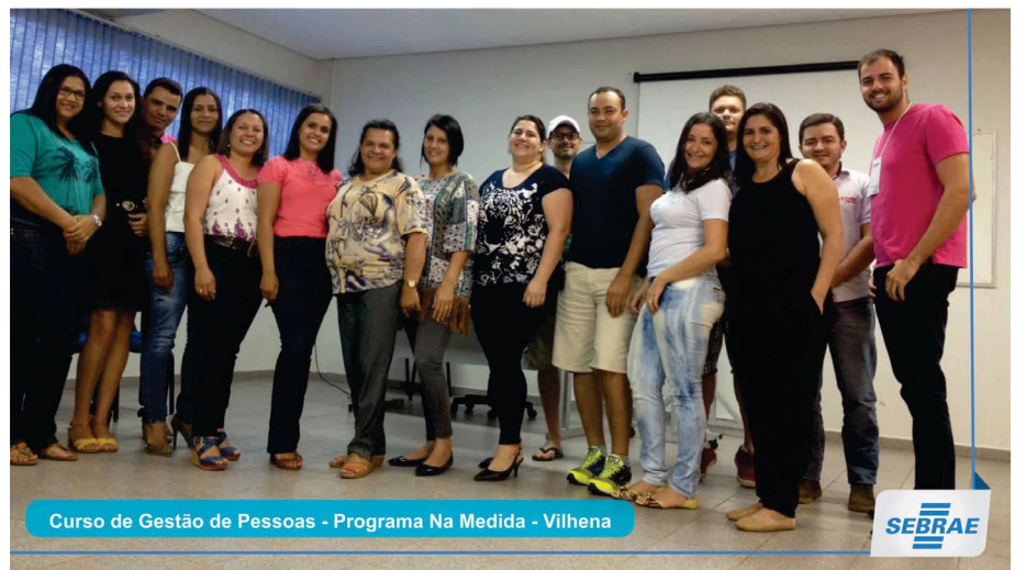
Curso de Gestão de Pessoas - Programa Na Medida - Vilhena