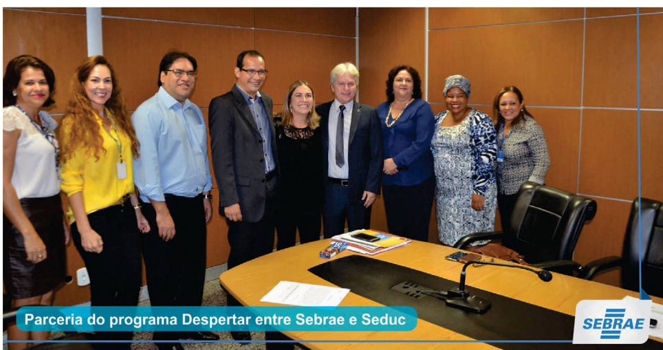
Parceria do programa Despertar entre Sebrae e Seduc